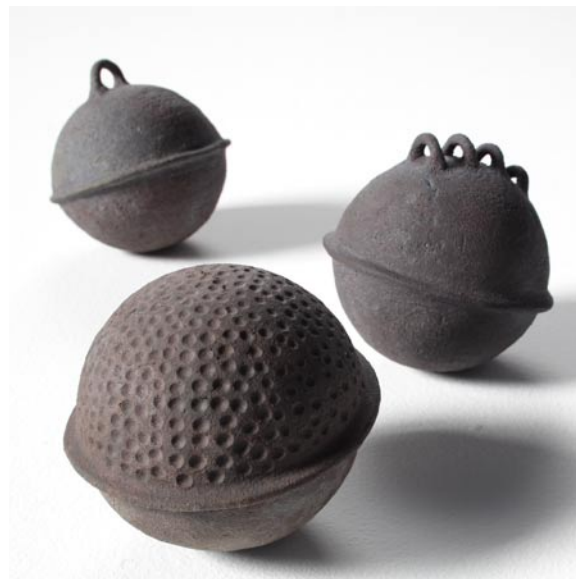
Virginie Besengez. Flotteurs

Du vendredi 11 au dimanche 13 mars 2011 de 10h à 19h, salle Olympe de Gouges